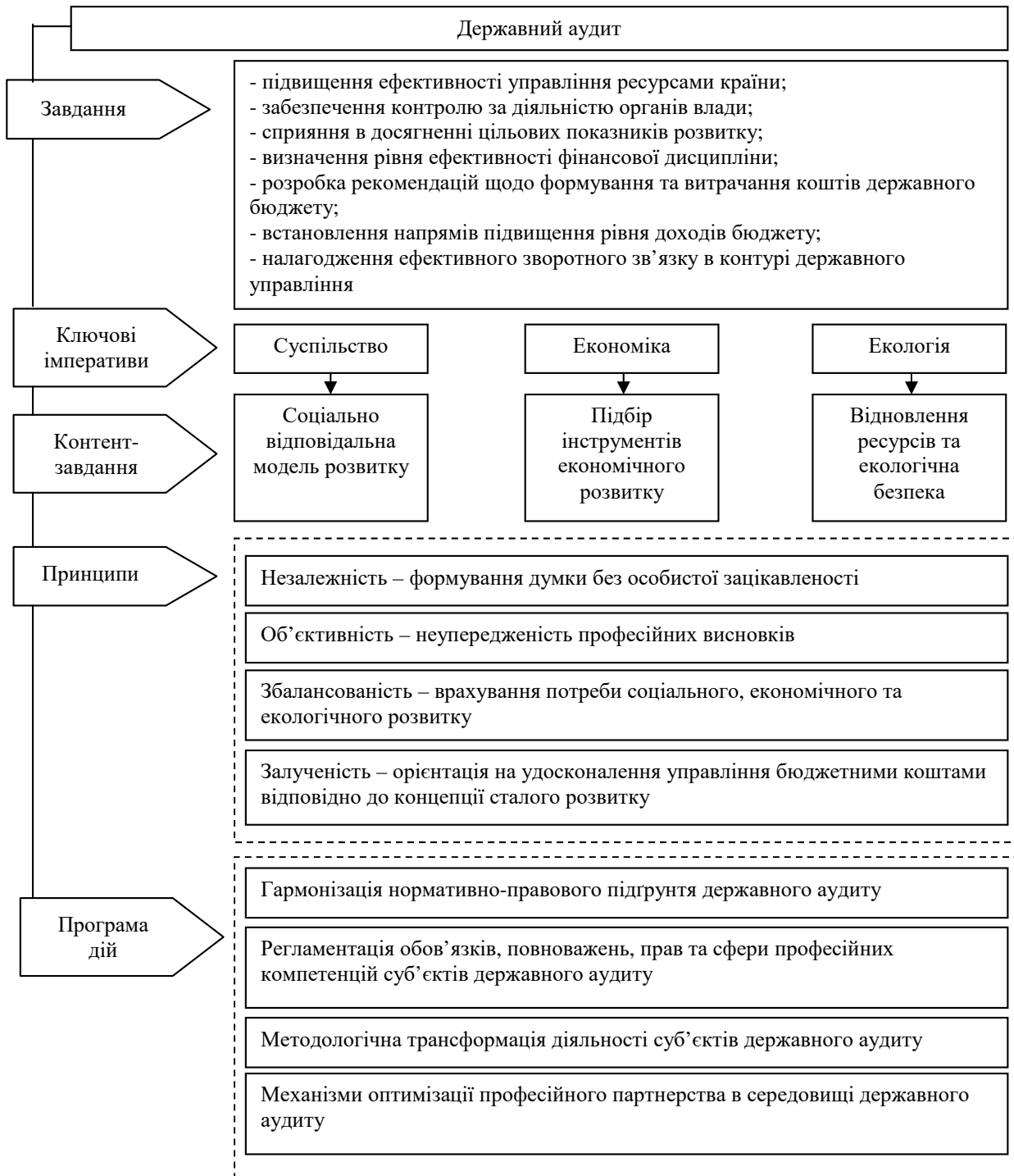
Рис. 1. Концептуальний базис державного аудиту

визначення напрямів розвитку, що відповідає загальній державній політиці, у чому виявляється трансформаційний контекст щодо використання коштів з державного та місцевого бюджетів. На підставі державного аудиту здійснюється оцінка економічності, результативності та продуктивності бюджетних коштів, що полягає в визначенні рівня ефективності щодо своєчасності та повноти бюджетних надходжень з подальшим їх використанням за напрямами політики розвитку (рис. 1).