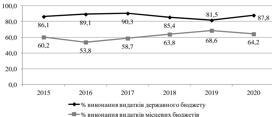
Рис. 6. Виконання державних програм охорони навколишнього природного середовища в Україні протягом 2015-2020 рр., %

Розглянемо більш детально рівень фінансування бюджетних програм з охорони навколишнього середовища (рис. 6).