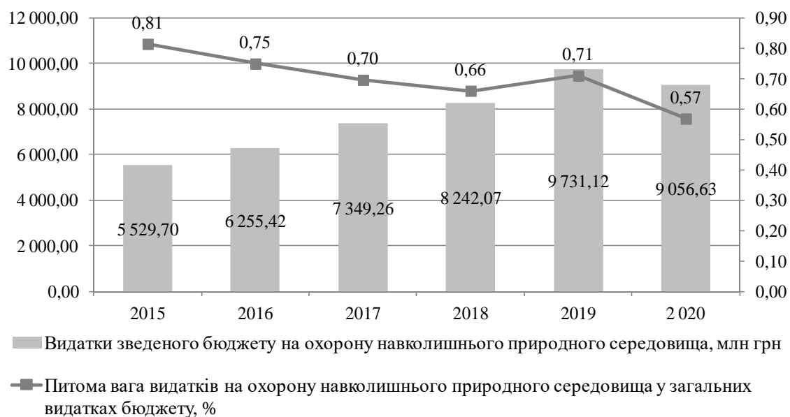
Рис. 3. Динаміка всіх витратків на охорону навколишнього природного середовища та їх частки в загальних витатках бюджету України протягом 2015-2020 років

З огляду на це, проаналізуємо стан фінансування загальних видатків зведеного бюджету України на охорону навколишнього природного середовища (рис. 3), а також їх склад (табл. 1) та структуру (табл. 2) протягом 2015-2020 рр.