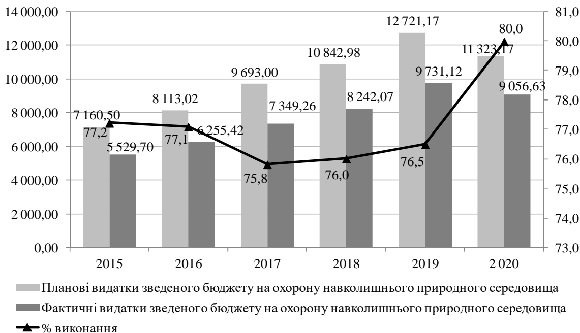
Рис. 4. Динаміка всіх фактичних та запланованих витатків бюджету на охорону навколишнього середовища в Україні за 2015-2020 рр., млн грн

Проаналізуємо витатки зведеного бюджету на охорону навколишнього природного середовища в Україні за планом і за фактом в динаміці (рис. 4).