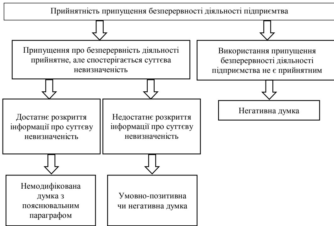
Рис. 2. Вплив результатів оцінки дотримання принципу безперервності діяльності на думку аудитора Джерело: складено авторами.

Отже, за умови невиявлення суттєвого викривлення в бухгалтерській (фінансовій) звітності у клієнта, аудитор може видати немодифікований аудиторський звіт, якщо: