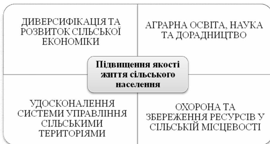
Рис. 2. Нове концептуальне бачення сталого розвитку сільських територій