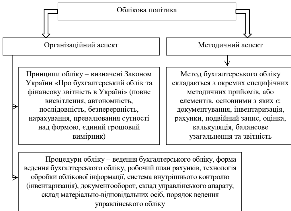
Рис. 1. Складові облікової політики відповідно до законодавства

їх варіант, а також попередні оцінки, які використовуються підприємством з метою розподілу витрат між відповідними звітними періодами [6].