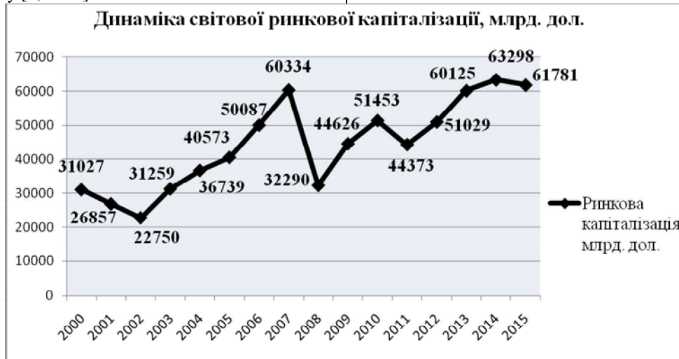
Рис. 1. Динаміка світової ринкової капіталізації за 2000-2015 рр.

Розглянемо світову динаміку ринкової капіталізації загалом за період з 2000 р. по 2015 р. за даними Світового банку [4].