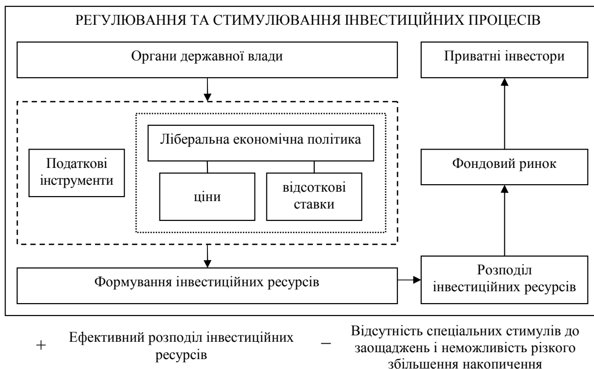
Рис. 1. Американська модель інвестиційної політики держави