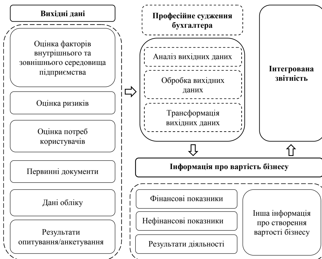
Рис. 2. Роль професійного судження у наданні інформації про створення вартості бізнесу

Отже, бухгалтер є зв'язуючою ланкою між сукупністю вихідних даних та представленою у звітності інформацією. На рисунку 2 схематично відображено місце професійного судження в забезпеченні оцінки вартості бізнесу.