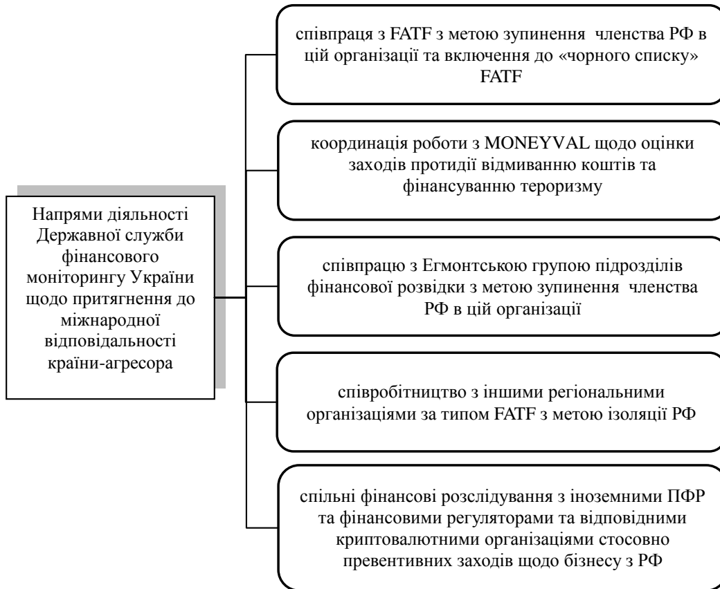
Рис. 1. Пріоритетні напрями діяльності Держфінмоніторингу щодо притягнення країни-агресора до міжнародної відповідальності

фінансової розвідки, скоординувала свої основні зусилля на притягнення до міжнародної відповідальності Росії за її злочини, у тому числі за відмивання «брудних» грошей, фінансування тероризму та фінансування розповсюдження зброї масового знищення. У цьому контексті пріоритетними напрямками діяльності Держфінмоніторингу є такі, що представлені на рис. 1.