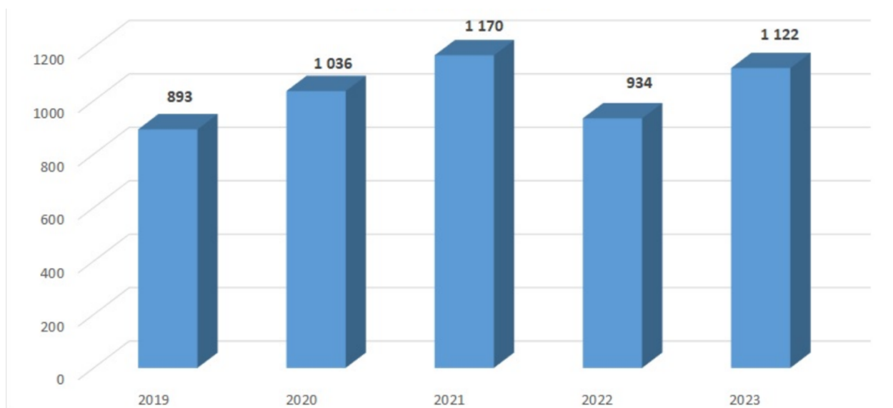
Рис. 3. Динаміка переданих матеріалів правоохоронним органам Державною службою фінансового моніторингу України у 2019-2023 рр.

Також спостерігається зростання кількості переданих матеріалів правоохоронним органам Державною службою фінансового моніторингу України за 2019-2023 рр. (рис. 3).