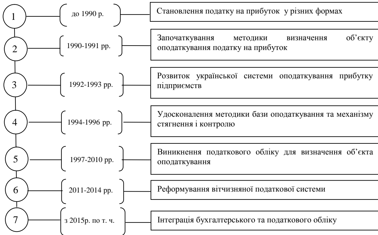
Рис. 2. Періодизація розвитку методичного забезпечення розрахунку і сплати податку на прибуток

Отже, важливим елементом діалектичного методу дослідження методики визначення податку на прибуток є принцип історизму, який відіграє важливу роль у розкритті економічного змісту його об'єкта оподаткування. Застосування історичного методу дозволило з'ясувати якісні зміни, яких зазнала податкова система оподаткування прибутку підприємств під час її становлення та розвитку. Періодизація розвитку методики визначення податку на прибуток представлена на рис. 2.