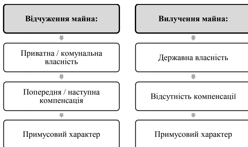
Рис. 3. Юридично-облікові підстави реквізиції майна в умовах військового стану