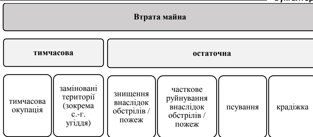
Рис. 1. Класифікація втрат майна під впливом воєнних дій